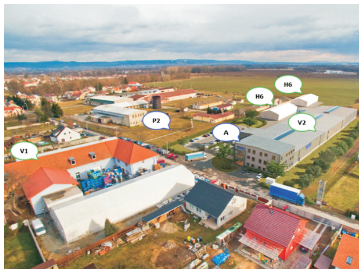
Původní stav s označením objektů podléhajících změnám, vs. současný stav realizovaných budov V1, V2, H6 a plánovaných objektů A (administrativa), P2 (parkoviště)