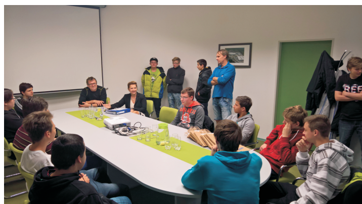
Studenti SŠ - budoucí elektrikáři