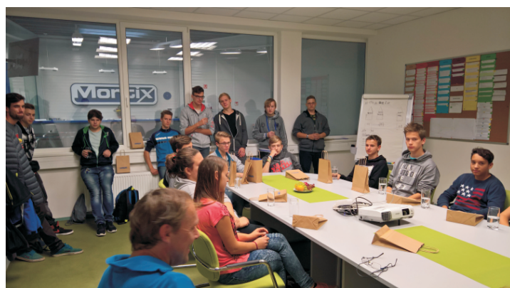
Studenti SŠ - budoucí nástrojaři